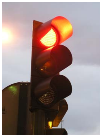
Semáforo de vehículos

A continuación indícanse os investimentos correspondentes aos semáforos con tecnoloxía LED e a recuperación dos investimentos adicionais respecto a semáforos con lámpadas incandescentes. Os semáforos de tecnoloxía LED requiren maiores investimentos ca os semáforos con lámpadas incandescentes (ou halóxenas) pero como consecuencia do seu menor consumo de enerxía, do seu baixo mantemento e da súa longa vida útil, o sobreinvestimento pode recuperarse nuns 5 anos.