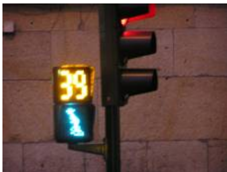
Semáforo de peóns con indicación do tempo que resta para cruzar

Maior resistencia ao impacto. Redución dos efectos do vandalismo.